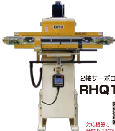
2軸サーボロボット RHQ120