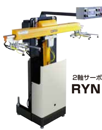
2軸サーボロボット RYN120