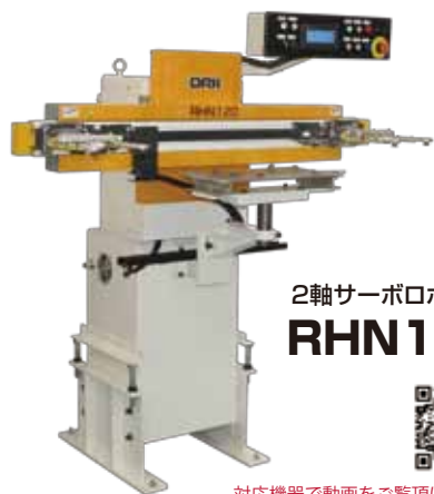
2軸サーボロボット RHN120